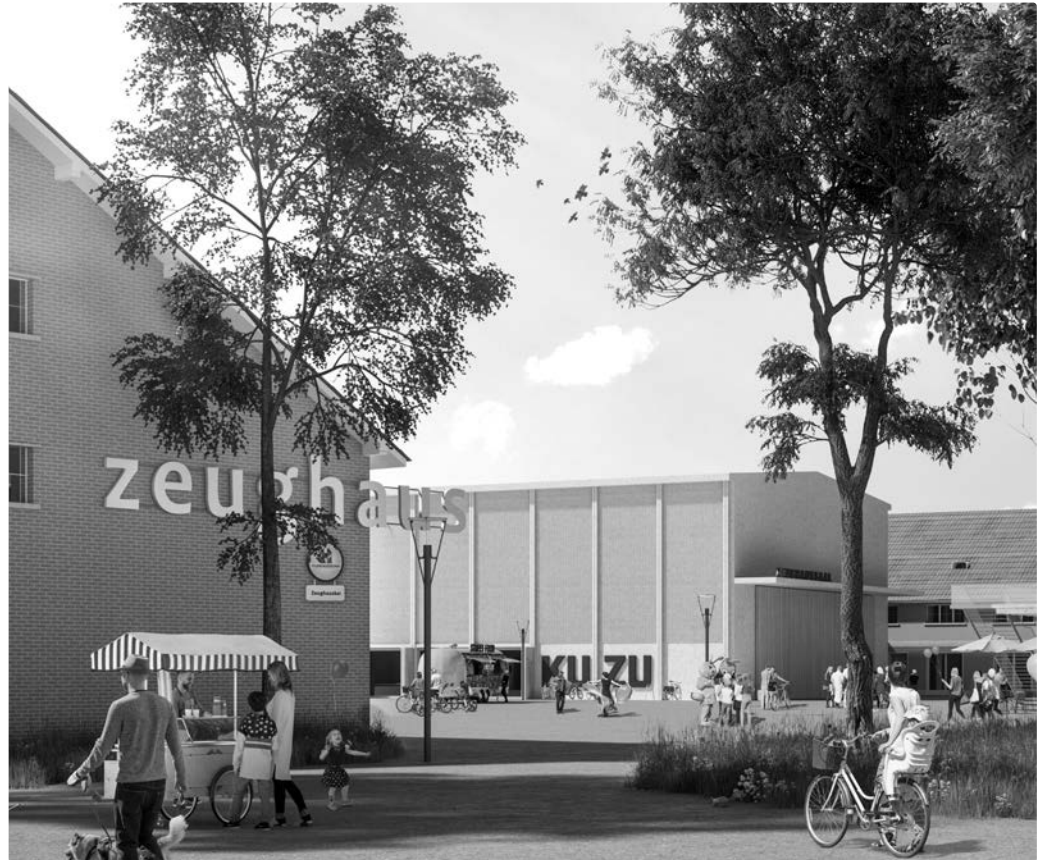
Der wohl wichtigste Erfolg in dieser Legislatur: Auf dem Zeughausareal kann die Arbeit für das Begegnungs- und Kulturzentrum weitergehen.

Ein wichtiges Thema der SP sind gleiche Löhne für