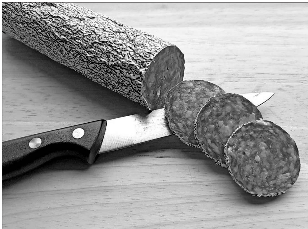
Salamitaktik pur: Die Abschaffung der Emissionsabgabe ist nur der erste Schritt der bürgerlichen Steuersekungs-Offensive.

Kommt hinzu: Der Steuerausfälle zugunsten der Grosskonzerne und Finanzunternehmen werden wir alle zahlen müssen. Denn es gibt nur zwei Möglichkeiten, das Loch in der Kasse zu stopfen: Entweder durch höhere Steuern auf Arbeitseinkommen. Oder aber der Staat kürzt Leistungen. Beides trifft vor allem den Mittelstand oder die arbeitende Bevölkerung. Eine klassische Umverteilung der Steuerlast von oben nach unten. Das gilt es zu verhindern.